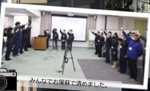
みなさんでお屠蘇で清めました。