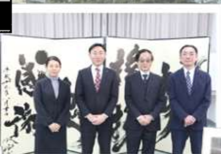
取締役、社是の屏風を背にして撮影。