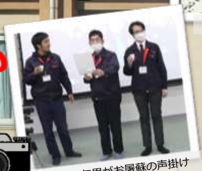
各年代の年男がお屠蘇の声掛け