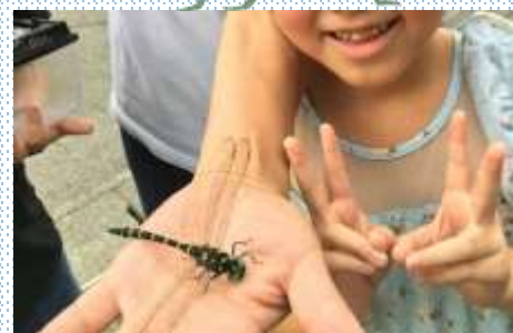
オニヤンマは〇〇ヤンマ

私の地元はマタギで有名な町になります。5月には熊祭りがあり、熊鍋がふるまわれます。山中のラーメン屋には熊ラーメン（熊の手入り）がありまして、なんと10万円だそうです。