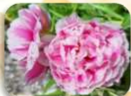
八重咲ツバボタン