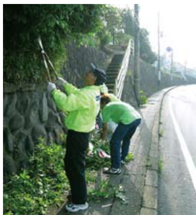
伐採する手にも力が入ります

今年もクリーン作業が楽しい季節到来！ 梅雨なんてふきとばせ〜！と、6月5日に 地域クリーンキャンペーンを実施しました。 例年よりも肌寒い日が続いたにも関わらず、 雑草や木は元気に枝葉を伸ばすんですね。 不安定な気温で体調を崩す人間が多い中、 それに負けない植物の生命力には本当に 関心させられます。