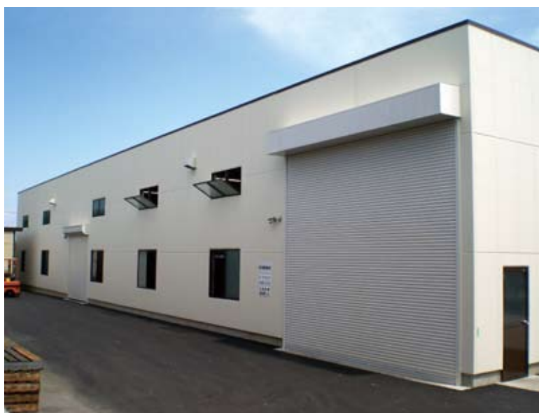
左：広々とした新工場内