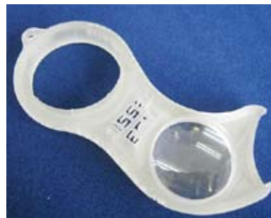
左:ループ付きオープナー (弊社デザイン仕様)

現在も独自に開発中で、中にループを入れるなど幅広いニーズにマッチする製品へと変貌を遂げつつあります。