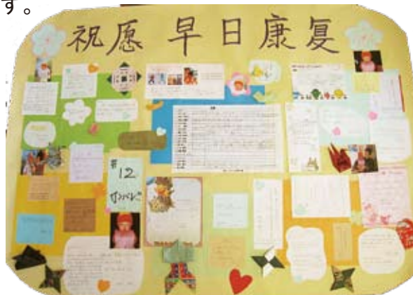
中国工場スタッフの心臓病のお子さんに宛てたメッセージ