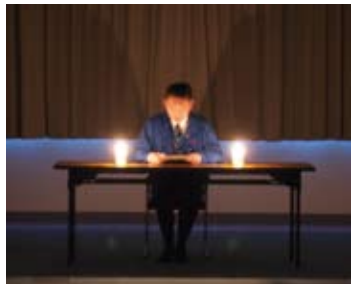
灯火(ともしび)の会/ロウソクの灯火だけで行う「語る会」です