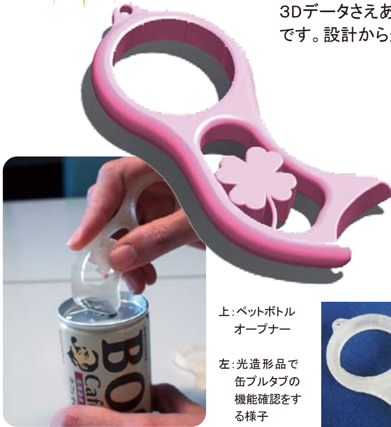
上:ペットボトル オープナー

開発品の形状確認を行うにあたり、光造形は欠かせません。3Dデータさえあれば、どんな形状でも形にすることが可能です。設計から造形まで、デザインの幅が広がります。