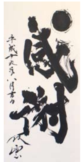
社訓（武田双雲氏による）

会社も家族も同じ、全員一丸となれる環境があり、社員の団結力は弊社独特の理念から生まれます。 このような企業風土や教育システムを見たいという依頼が絶えず、2009年は約100社が会社見学に来られ、 2010年も好評をいただいております、多くのご来社を予定しております。