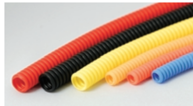
コルゲート(ワイヤーハーネス用)