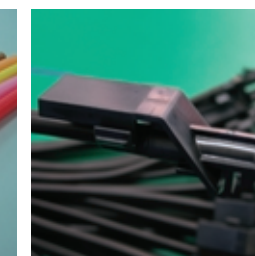
ウインドウォッシャーホース