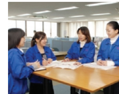
海外スタッフと本社共同で作業標準書作成の打ち合わせ風景

ニッセイエコでは、かなり積極的に国際的な人材登用を進めています。優秀な人材であれば、その工場だけでなく、グループ全体の指導や改善をどんどんと任せていきます。 そして今や、かつて日本人から指導を受けた現地スタッフが、本社に出向いて情報共有を図るといった、国を超えた技術の還流も当たり前に行われています。 このような偏見のない環境で人を活かし、グループ全体の標準化、レベルアップを加速化させています。