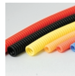
コルゲート (ワイヤーハーネス用)

自動車、医療、電子、電気など様々な分野に向けて、お客様の近くでの生産・供給を行っています。