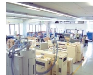
機械設備のほとんどは自社で製造するなど自給自足を徹底

ニッセイエコは独立独歩の精神を大切に、機械設備や原料、そして金型までも、万が一に備えて出来る限り自前で賄うことに取り組んで参りました。機械設備の不具合が生じて、即座に本社から技術者を派遣することも出来ますし、このように自社内でコントロール可能な要素がたくさんあることで、海外工場も非常にスムーズに運営出来ています。 様々な外部要因がある海外でこそ、この「自給自足」精神の本領が発揮されると言えます。