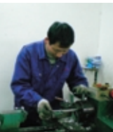
上海工場での金型製作風景。現地の「オールインワン工場化」にも着手。