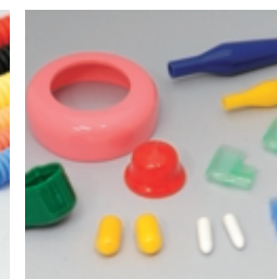
ディップ製品 (バイク向け製品など)