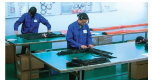
ウインドウォッシャーホース組み立て

2004年から操業開始し、コルゲート、チューブ、ディップ製品を製造。また自動車のウインドウォッシャーホースのアッセンブリーもここで行っています。