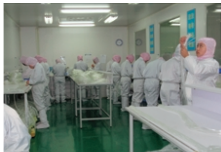
クリーンルーム内での医療用チューブ製造風景。現地でも高い品質を維持。

さらには、これまで本社で行っていた「オールインワン工場」化にもチャレンジし、金型製作や原料製造も開始。これによりお客様と、現地同士で設計段階からスピーディかつ精度の高いやり取りが可能となり、単にモノを作るだけでなく、現地での製品開発・改良という次のステージにも貢献できるものと考えております。