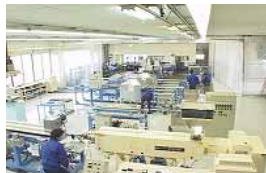
【機械】までも自社開発・製造