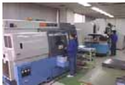
【金型】から自社製作

ニッセイエコは、原料、金型、さらには機械まですべてを自社内で製造するオールインワン工場。だから速く・安く・確実な品質でお届けすることが可能です。