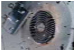
【原料】も自社開発・製造