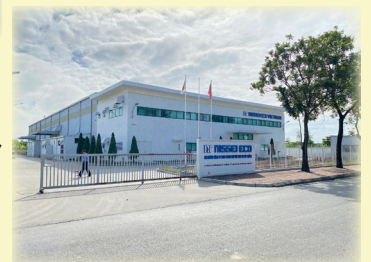
ベトナム・ダイアン