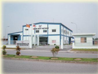
ベトナム・ハイフォン